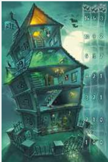
1 plateau de jeu