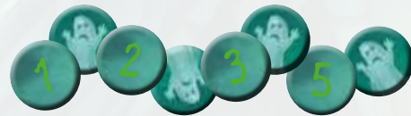
75 jetons « Spookies »

(30 x 1 point, 20 x 2 points, 15 x 3 points, 10 x 5 points)