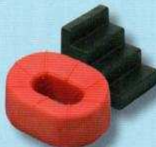
Les gradins et les stades