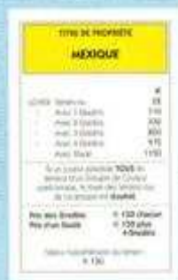
Les titres de propriété