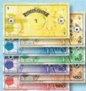
Les billets de banque

Choisissez un joueur qui sera le banquier. S'il y a plus de 5 joueurs, le banquier peut choisir de n'assurer que ce rôle. Le banquier se charge des éléments suivants :