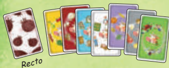
7 cartes Catégorie avec 7 couleurs de fond différentes