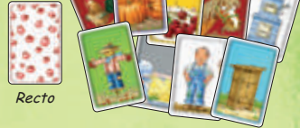
49 cartes Objet déclinées en 7 couleurs différentes