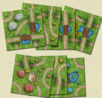
7 tuiles Jardin