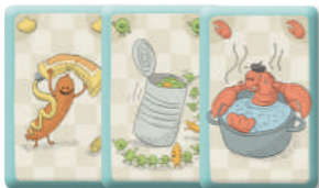
carte dei cibi

Che ghiottoneria!!! Oggi i mostri hanno di nuovo una gran fame! Chi riuscirà a saziare questi due mangioni viziati? Ma attenzione! Per ogni cibo dovete avere una coppia di carte, così potrete nutrire i due mostri contemporaneamente. Altrimenti si ingelosiscono e iniziano a bisticciare. E poi sono molto viziati e mangiano ogni vivanda una volta sola. Iniziate subito a comporre un delizioso menù da 10 portate, perché solo così riuscirete a saziare i mostri!