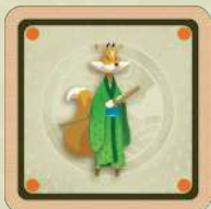
Le kitsune (renard). 1 autocollant recto