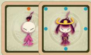
Le kodama (esprit de l'arbre). Il peut se transformer en kodama samurai . 2 autocollants recto verso

La position de départ des yōkai est telle qu'indiquée sur le dessin ci-contre. Ils sont tous positionnés en début de partie sur leur face à points orange . Un rappel est dessiné sur le bas du plateau.