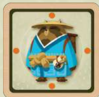
Le tanuki (sorte de raton-laveur). 1 autocollant recto