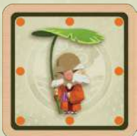
Le koropokkuru (lutin). Il est le maître des yōkai . 1 autocollant recto

Chaque joueur dispose de quatre types de yōkai – esprits de la forêt. Ils ont tous une face à points orange ; un seul peut se transformer et être retourné sur sa face à points bleus (le kodama ) :