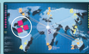
3 sur le même serveur