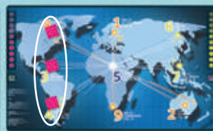
3 en ligne orthogonal