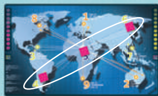
3 en ligne diagonal

Vous êtes un hacker réalisant des missions autant pour l'argent que la gloire. Votre contrat actuel consiste à infecter avec vos marqueurs Virus 3 serveurs principaux connectés en ligne (3-5-7, 1-5-9, 8-5-2, 4-5-6, 8-1-6, 6-7-2, 4-9-2, 8-3-4) d'où à en détruire un avec une attaque triple (3 marqueurs sur le même serveur).