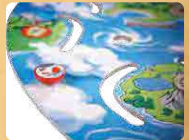
casilla de salida