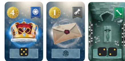
Exemple de placement de dés Serviteur

Revendiquer : placez autant de Serviteurs que vous désirez sur les cartes Trésor en choisissant la valeur des dés pour déterminer l'effort de chaque serviteur (plus la valeur est haute, plus le serviteur risque de s'épuiser). Vous pouvez placer plusieurs dés sur une même carte s'ils ont la même valeur d'effort.