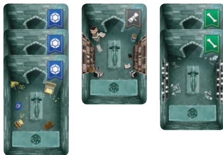
Exemple des Trésors d'un joueur

Placez vos Trésors face cachée en colonnes devant vous, triés par type. Vous pouvez les regarder à tout moment.