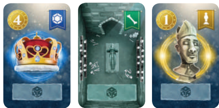
Exemple de Crypte pour 1 Joueur

Placez les Trésors de la plus haute valeur en Pièce(s) à la plus petite. La carte face cachée équivaut à 2,5 Pièces. Si 2 cartes sont égales, la première carte tirée est placée à gauche.