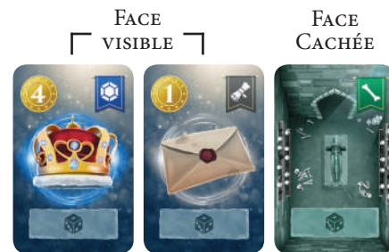
Exemple de Crypte pour 2 joueurs

Les premières cartes tirées sont placées face visible. La(les) dernière(s) est(sont) face cachée.