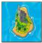
2 ème carte île