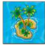
3 ème carte île