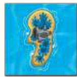
4 ème carte île