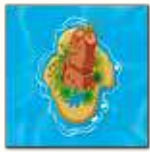
1 ère carte île