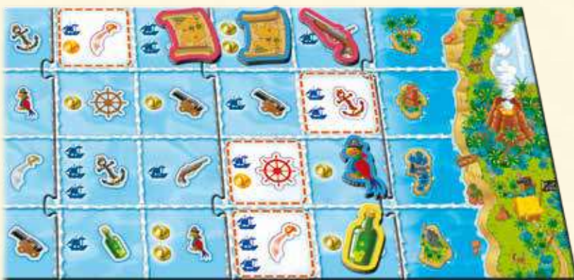
A ce stade de la partie, les objets peuvent être déposés sur ces quatre emplacements.

Dès qu'un joueur pense avoir trouvé le bon objet dans son sac, il le sort et le regarde. Si c'est bien l'objet qu'il lui faut, il se dépêche de le placer sur le plateau à l'emplacement de l'image correspondante. A partir de ce moment là, les autres joueurs peuvent remplir l'emplacement suivant sur le plateau.