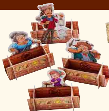
4 personnages avec coffre

(partie inférieure de la boîte avec double fond pour l'effet d'explosion)