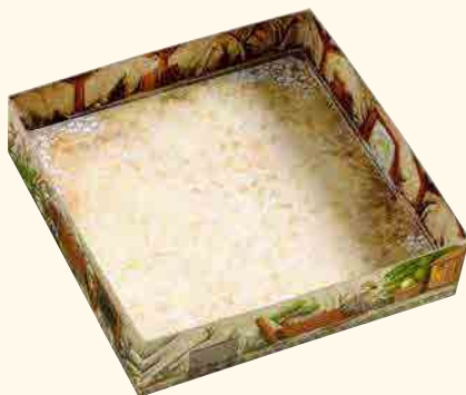
1 mine d'or

(partie inférieure de la boîte avec double fond pour l'effet d'explosion)