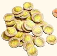
35 pépites d'or licites