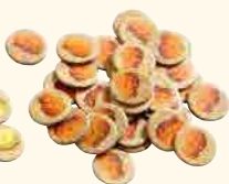
35 pépites d'or illicites