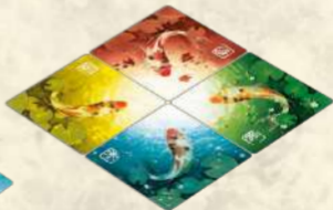
YOZUMI de Carpes