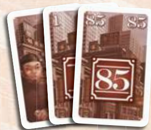
85 cartes Immeuble