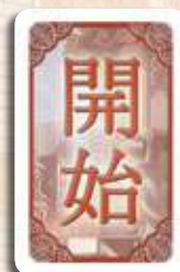
1 carte Premier joueur