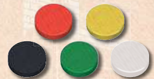
150 marqueurs Propriété (30 dans chacune des 5 couleurs)