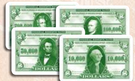
84 cartes Argent (réparties en billets de 10,000$, 50,000$, 100,000$ et 200,000$)