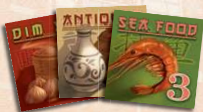
90 tuiles Commerce