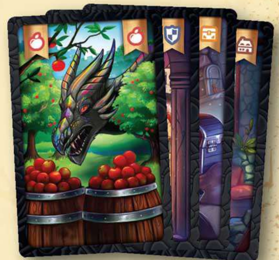
4 cartes Dragon