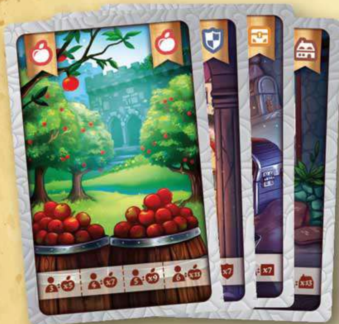
4 cartes Lieu Neutre (Verger, Armurerie, Salle du trésor, Village)