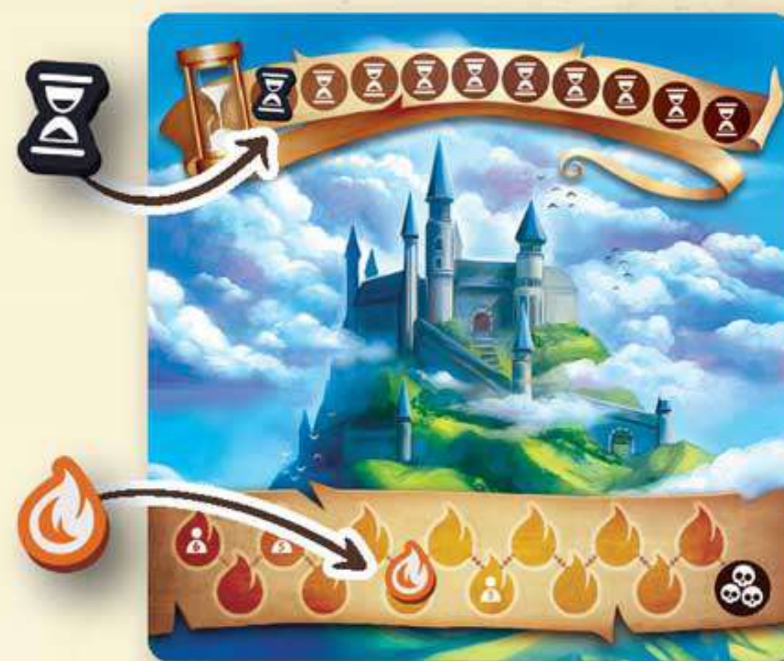
Exemple de mise en place pour le joueur Dragon lors d'une partie à 4 joueurs

Les jetons Maison sont placés à proximité de la carte Village. Cette réserve représente l'objectif de construction des Héros en fonction du nombre de joueurs. Les jetons non utilisés sont remis dans la boîte.