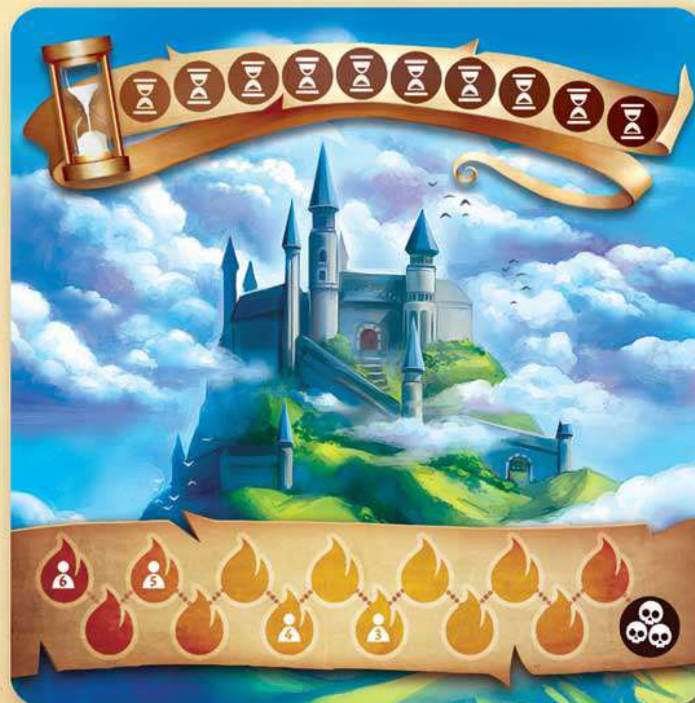
1 plateau Château