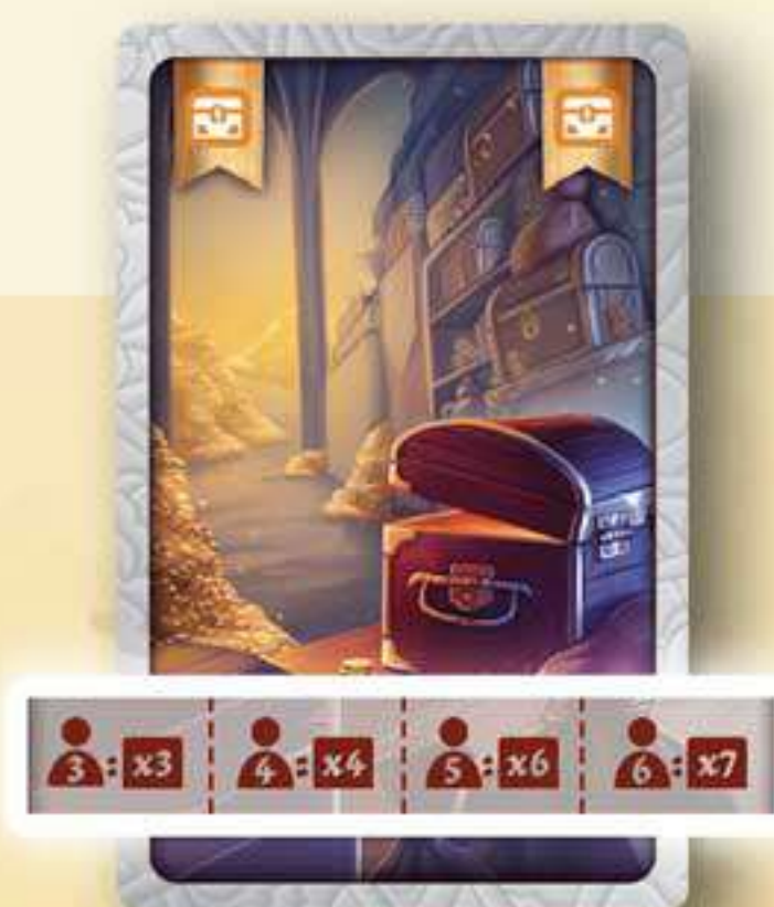
Salle du Trésor