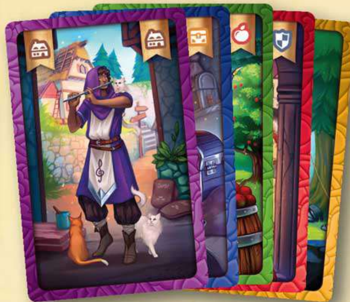
25 cartes Héros (4 cartes Lieu + 1 carte Campement par Héros)