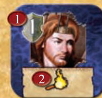
Côté face visible