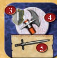
Côté face cachée

1. Force Normale. Quand il est face visible, le Chef ajoute sa force normale à l'armée avec laquelle il se trouve.