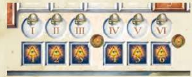
Echelle d'époque avec les époques 1 à 6