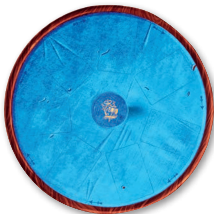
1 plateau de jeu