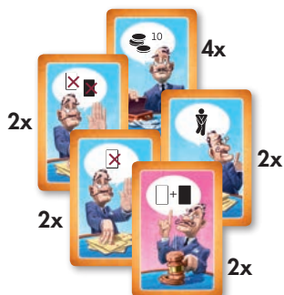
12 cartes commissaire-priseur