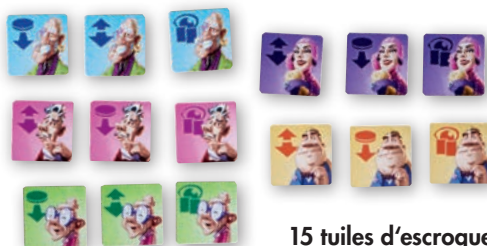
15 tuiles d'escroquerie