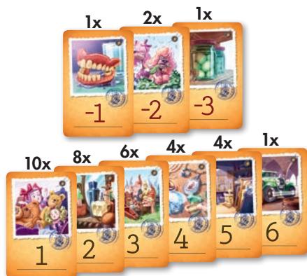
37 cartes objet

Au cours d'une vente aux enchères mouvementée, les héritiers tentent d'acquérir les meilleurs lots de la succession et de laisser à leurs rivaux les objets sans intérêt. Pour y parvenir, aucun fairplay : ils trichent, ils intervertissent des lots, et il leur arrive même d'emprunter de l'argent à un autre héritier.