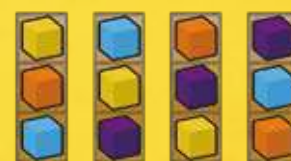
Demandes de la ville

7) Placer au hasard les 8 jetons Palais , face jaune visible , sur les 8 emplacements (G). Les emplacements (H) restent vides.