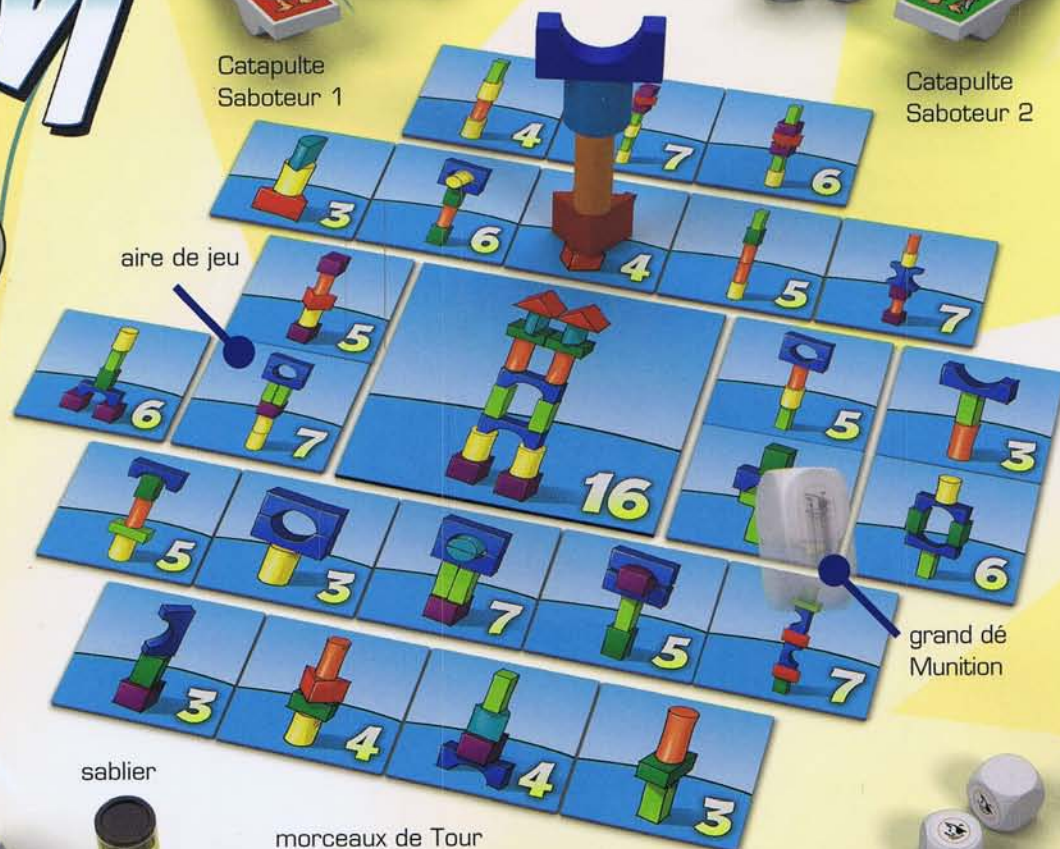
aire de jeu