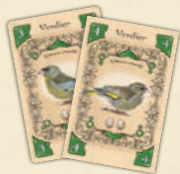
pas une paire