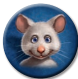
56 jetons Souris (dont 7 en supplément)