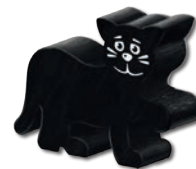
1 chat en bois

Auteur : Reiner Knizia · Illustrations : Andreas Resch · Maquette : Hans Schneider & C. Geigenmüller ·