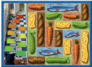
1 plateau double-face

À ses yeux, un bon jeu permet à tous de terminer la partie avec le sentiment d'avoir gagné, et ce quel que soit le résultat final, tant le plaisir de jouer était grand et gratifiant.