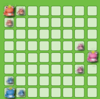
Pour 3 joueurs