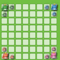
Pour 4 joueurs