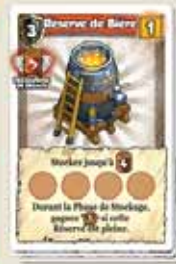
52 CARTES BÂTIMENT