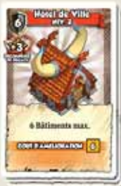
12 CARTES HÔTEL DE VILLE