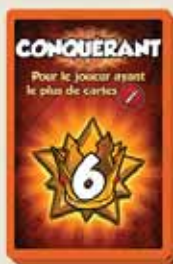
8 CARTES BONUS DE FIN DE PARTIE