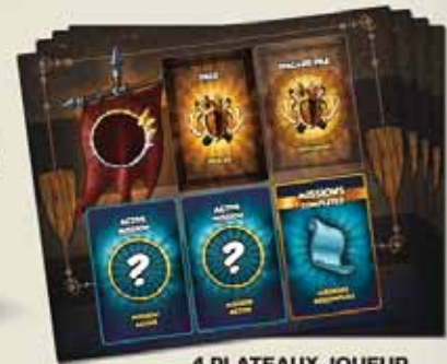
4 PLATEAUX JOUEUR