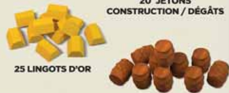
20 JETONS CONSTRUCTION / DÉGÂTS