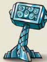
1 JETON PREMIER JOUEUR