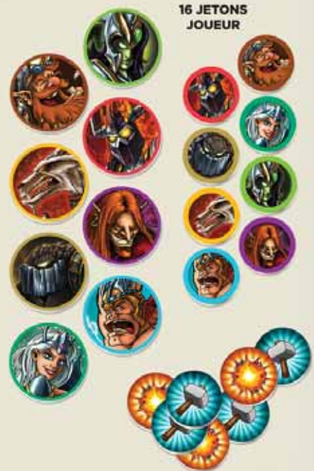
16 JETONS JOUEUR