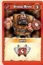
18 CARTES UNITÉ