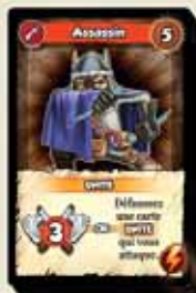
40 CARTES VOIE D'ODIN