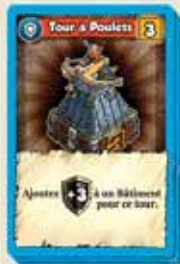
14 CARTES DÉFENSE