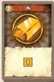
4 PAQUETS DE DÉPART