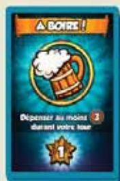
20 CARTES MISSION