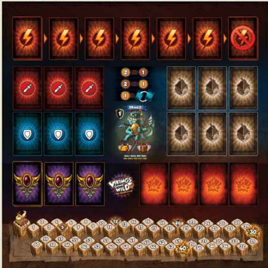
1 PLATEAU CENTRAL