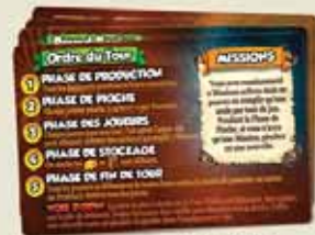
4 CARTES AIDE DE JEU