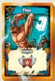
12 CARTES FAVEUR DIVINE