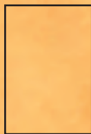
espace pour 3 cartes Objet