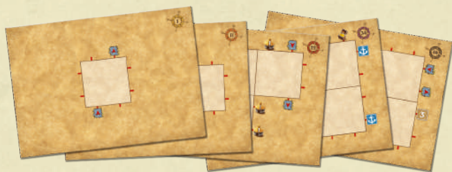
25 supports de puzzles recto-verso