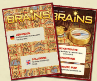
1 livret avec d'un côté les indices, et de l'autre les solutions.