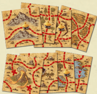
8 tuiles Carte au Trésor