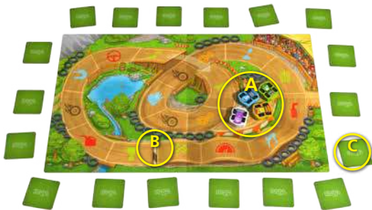
A = Startbereich, B = Ziellinie, C = Plättchen

Mischt die 18 Plättchen und legt sie verdeckt um den Spielplan herum aus.