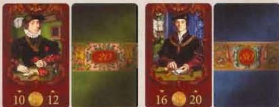
Ill. Carte Emprunt de 10 Florins de face et de dos

Pour prolonger ou rembourser un emprunt, il n'est pas nécessaire de naviguer vers la Banque.