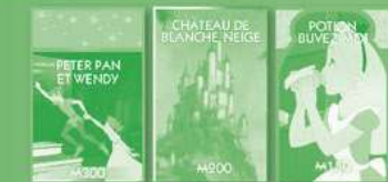
Personnages (groupes de couleur) Châteaux Potion et Biscuit

Vous pouvez acheter la propriété sur laquelle vous vous arrêtez en payant à la Banque le prix indiqué sur la case du plateau de jeu.