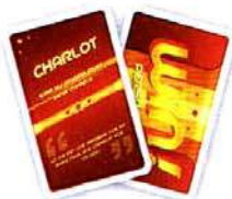
Les cartes PERSONNAGE