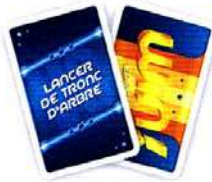
Les cartes ÉPREUVE