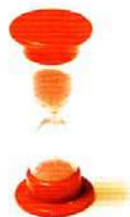
Le sablier de 20 secondes