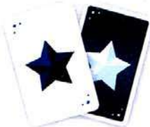
Les cartes VOTE