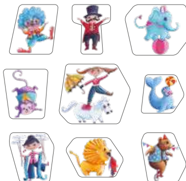
9 blocs Personnage en bois