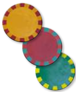
3 tuiles Podium