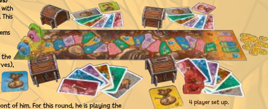
4 player set up.

Players place their Dwarves on the 'Start' square (outside the cave)