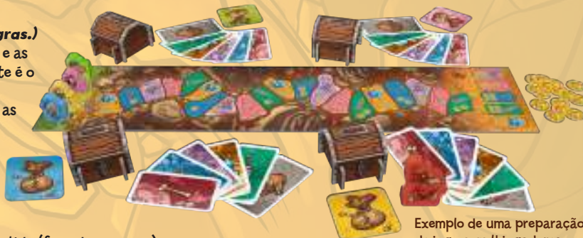
Exemplo de uma preparação de jogo com 4 jogadores

Os jogadores colocam os seus Anões na casa de partida (fora da caverna).