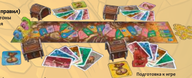
Подготовка к игре вчетвером

Самый юный игрок ставит фигурку дракона перед собой. В этом раунде он исполняет роль дракона. В следующих раундах роль дракона передаётся по часовой стрелке.