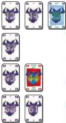
Fig. 2 : les 4 séries après le 1 er tour.

Le 14 est la carte la plus faible. C'est elle qui sera la 1 re à être déposée dans une série. Selon la règle n°1, elle ne peut être déposée que dans la 1 re série, derrière le 12 . De même pour le 15 . Selon la règle n°1, la carte 44 peut être déposée aussi bien dans la 1 re , que dans la 2 e ou la 3 e série. Mais, d'après la règle n°2, la règle de la plus petite différence, elle doit aller dans la 3 e série. D'après la règle n°2, la carte 61 doit être déposée dans la 4 e série.