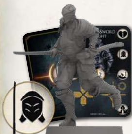
Alonne Sword Knight

Pour télécharger ce livre de règles dans votre langue, rendez-vous sur : steamforged.com/darksouls-expansions-rules