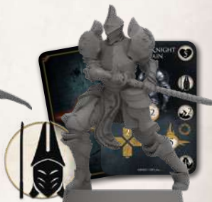
Alonne Knight Captain