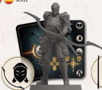
Alonne Bow Knight