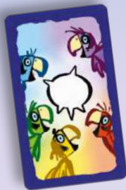
10 cartes papo-couleur