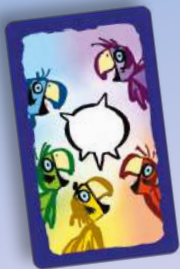
10 carte-colore parlagallo