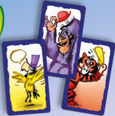
85 animal cards (35x parrots, 25x gorillas, 25x tigers)