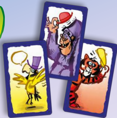
85 cartes d'animaux (35x perroquets, 25x gorilles, 25x tigres)