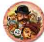
Douze marqueurs Crise