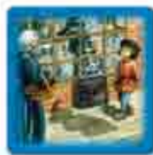
Une tuile Invisibilité