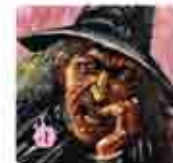
Douze tuiles Aliss la Noire