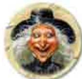
Seize marqueurs Ricanage