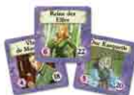
Dix-sept tuiles Gros Problème