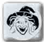
Quatre dés Sorcière