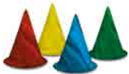
Quatre pions Sorcière

En plus du livre de règles que vous lisez actuellement, vous devriez également trouver dans cette boîte :