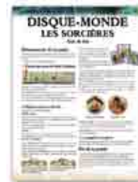
Une Aide de Jeu