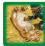
Une tuile Cochon Malade