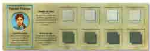
Quatre plateaux Apprentie Sorcière