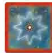
Une tuile Magie