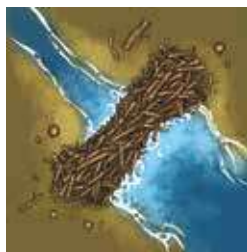
Le Barrage de Castor

Lorsqu'un joueur pose le Barrage de Castor en jeu, il reçoit immédiatement un jeton Récompense de son choix.